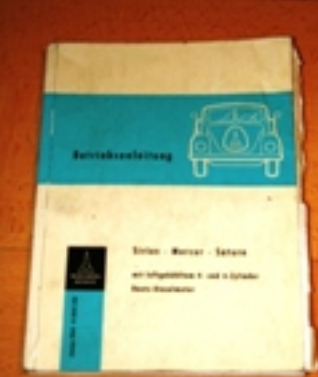
Bibliographie: Mercedes-Benz 6-Zylinder-Deutz-Dieselmotor