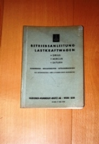
Bibliographie: Mercedes-Benz 4-Zylinder-Deutz-Dieselmotor