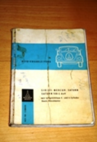
Bibliographie: Mercedes-Benz 6-Zylinder-Deutz-Dieselmotor